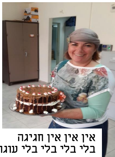
אין אין אין חגיגה בלי בלי בלי עוגה!