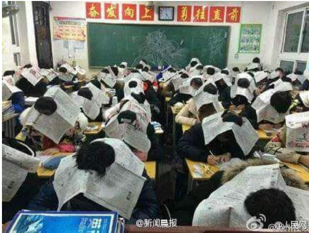
טוהר בחינות בסין...